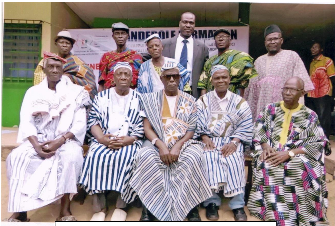
Une photo de groupe seulement avec les Leaders Communautaires lors de l'atelier d'Orientation / Formation