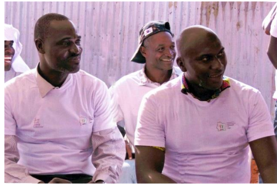
Une vue de la foule des participants à la Sensibilisation Plein Air