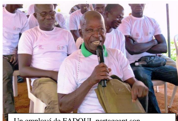
Un employé de FADOUL partageant son expérience en vue d'obtenir des réponses à ses inquiétudes sur les IST-SIDA et l'Ebola