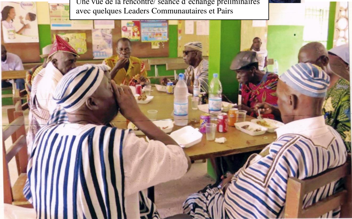
Une vue de la rencontre/ séance d'échange préliminaires avec quelques Leaders Communautaires et Pairs