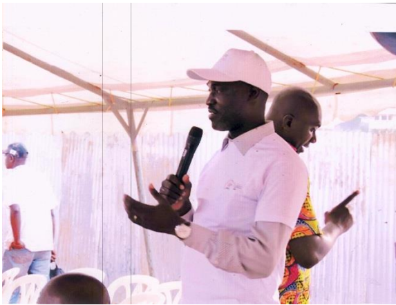
Le Directeur Exécutif de l'ARDPC donnant des réponses à certaines questions soulevées par les populations riveraines et les employés de FADOUL