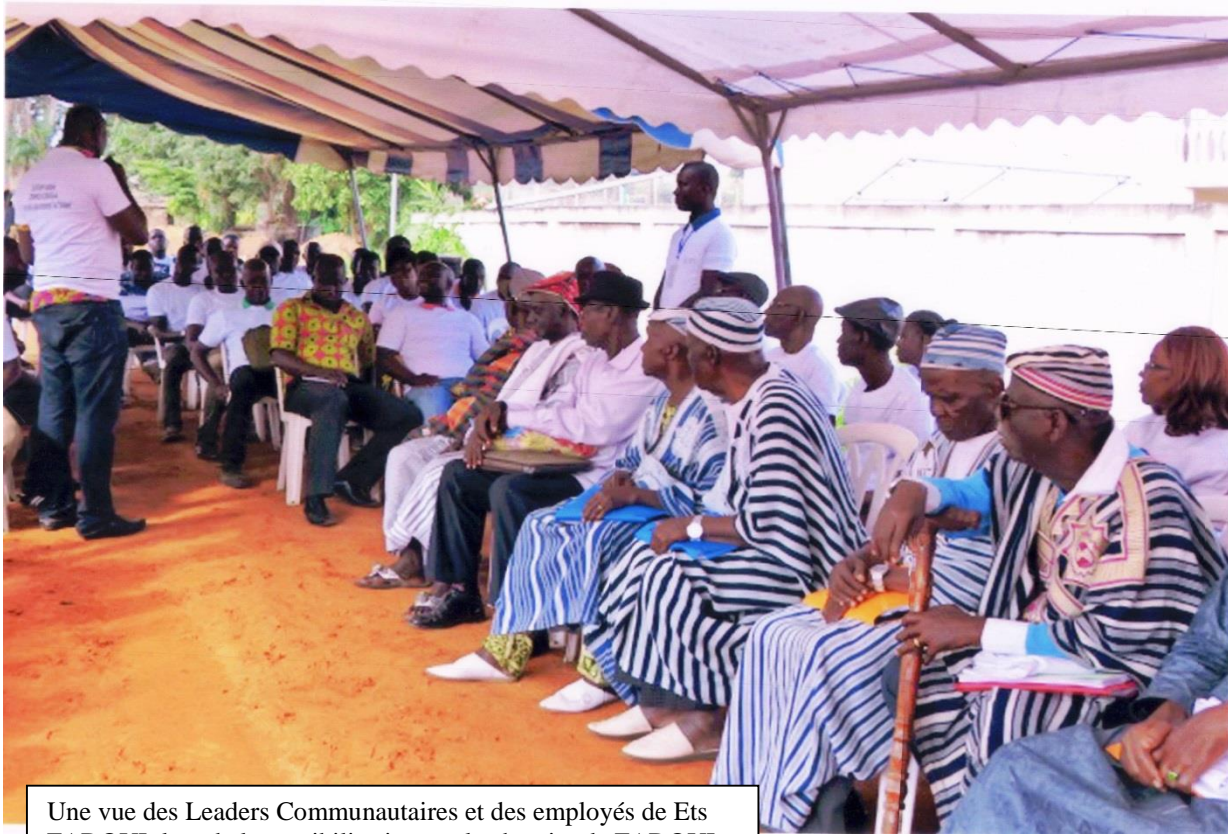
Une vue des Leaders Communautaires et des employés de Ets FADOUL lors de la sensibilisation sur le chantier de FADOUL au Carrefour de l'Indenié