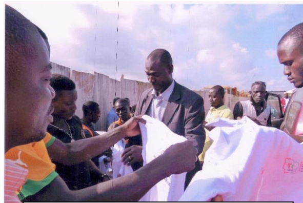
La séance de distribution de Tee-Shirts aux populations riveraines et aux employés de FADOUL avant la sensibilisation