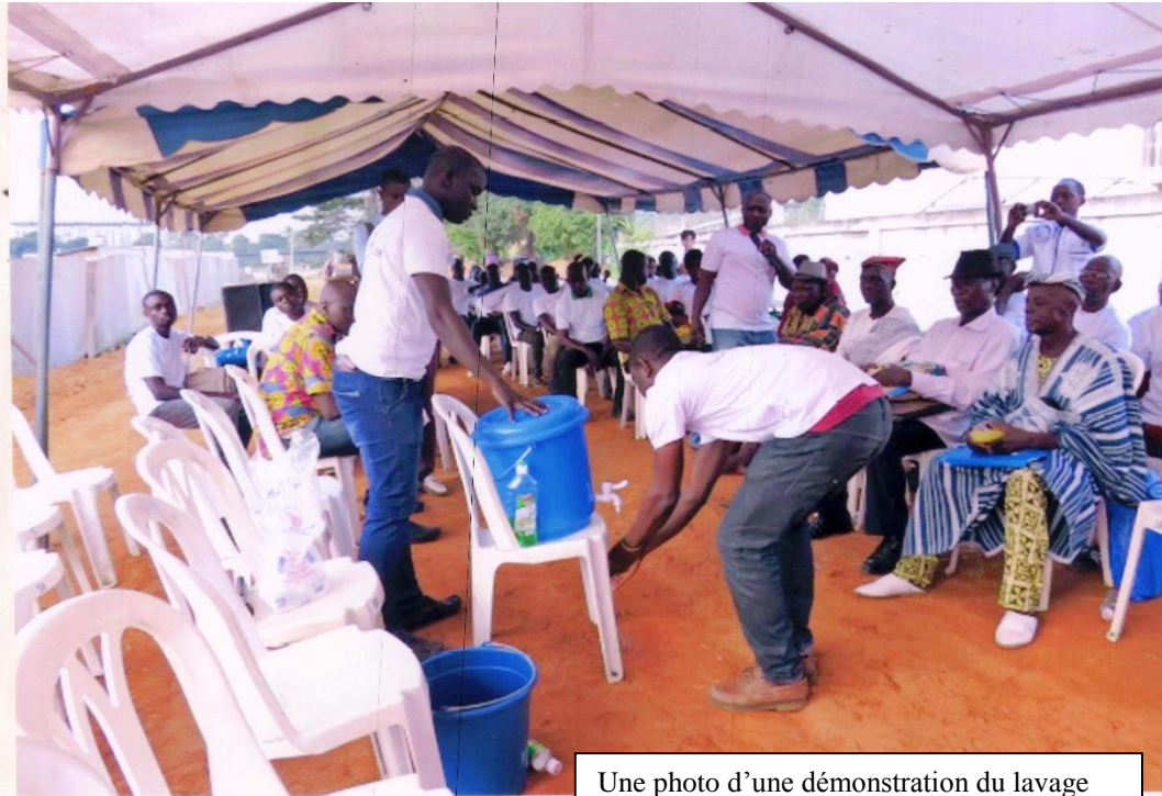
Une photo d'une démonstration du lavage des mains pour montrer comment se prévenir contre la maladie à virus Ebola par le lavage des mains.